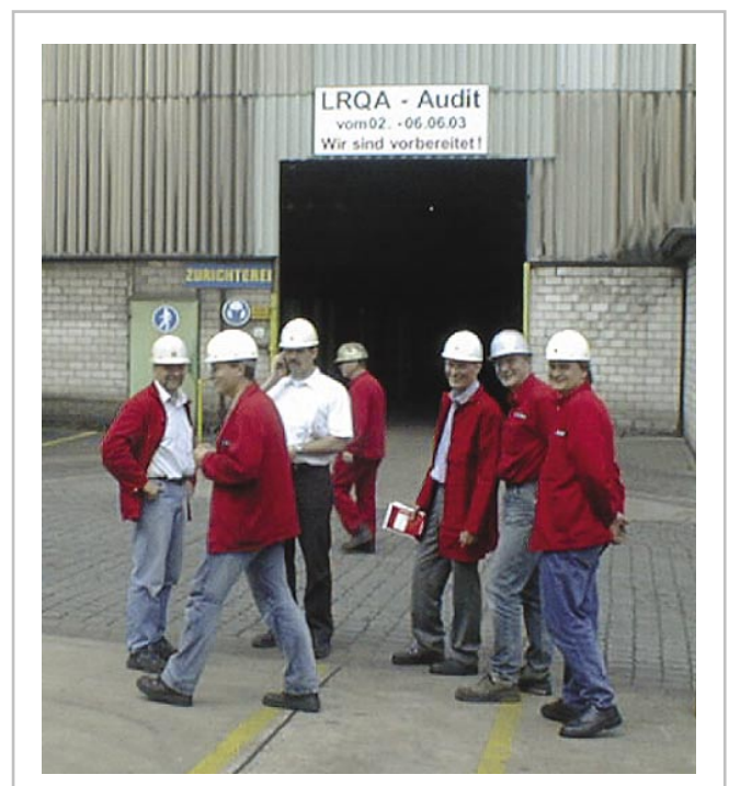
Die Zurichterei hatte sich auf das Audit bestens vorbereitet.